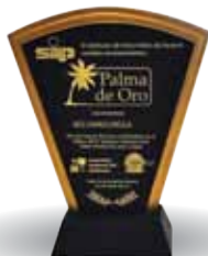
“Premio Palma de Oro”, entregado por el Sindicato de Industriales de Panamá