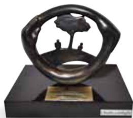
Premio al Buen Ciudadano Corporativo, de la Cámara Americana de Comercio, Mención Honorífica