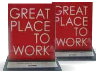
AES en Panamá entre los 10 mejores para trabajar en Panamá, Great Place to Work Institute